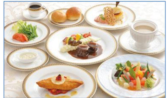
コース料理 (イメージ)

参加費 : 会員様 2,000 円 / 1 名 会員様同伴者・非会員様 5,000 円 / 1 名